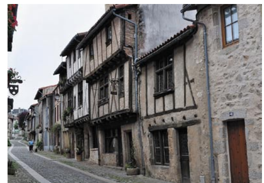
Rue de la Vau Saint-Jacques

Des tisserands y produisaient des draps à partir du XIIème siècle. Plusieurs maisons sont intéressantes et ont été remarquablement restaurées ; la plupart sont à pans de bois et colombages, certaines ont un encorbellement donnant sur la rue. En haut de la