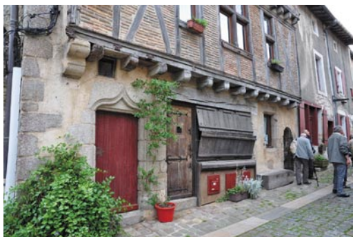
Une échoppe du Vieux Parthenay

Elle s'est développée autour d'une citadelle installée sur un éperon rocheux dans une boucle du Thouet. Après avoir été une cité importante au Moyen-Âge la ville a perdu sa vitalité après la guerre de cent ans. Pendant les guerres de religions elle est prise à trois reprises par les Protestants. En 1632, Richelieu ordonne le démantèlement du château. Au XVIIIème siècle, l'intendant du Poitou dote la province de routes, ponts et nouvelles infrastructures mais en même temps il fait supprimer de nombreux remparts dont ceux de Parthenay. Au moment de la Révolution Française, Parthenay est confrontée à l'insurrection vendéenne. L'armée vendéenne commandée par Lescure prend la ville une première fois le 9 mai 1793, puis une seconde fois le 14 juin. Le général républicain Westermann la reprend le 24 juin ; trois jours après, le 27, les vendéens pillent la ville qui est finalement