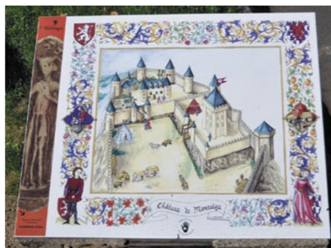
Terminus le château (toujours très beau, le temps)