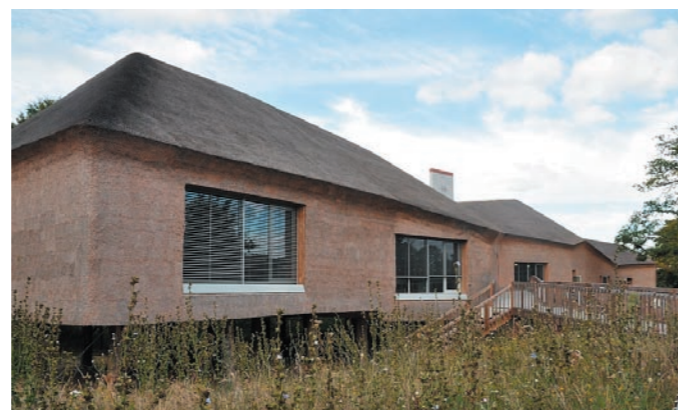
L'extension peut accueillir congrès et conférences

Pour en savoir plus : www.beautour-paysdelaloire.fr