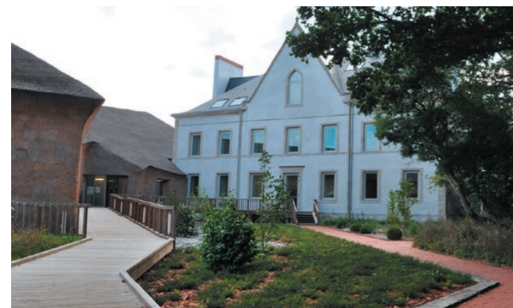
La demeure de Beautour, restaurée