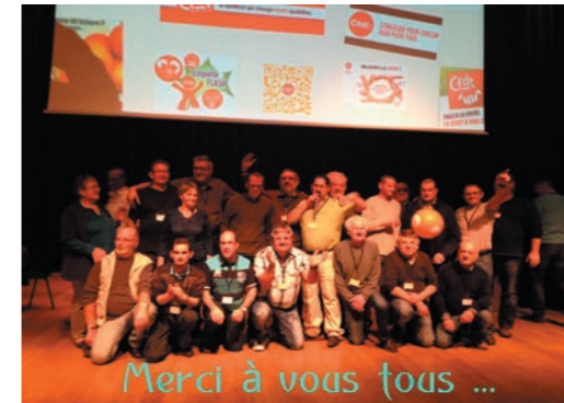
Les militants de l'UL de Montaigu qui ont largement contribué au bon déroulement du congrès

(sans compter tous les militants de l'UTR de Montaigu et nos représentants dans les UL)