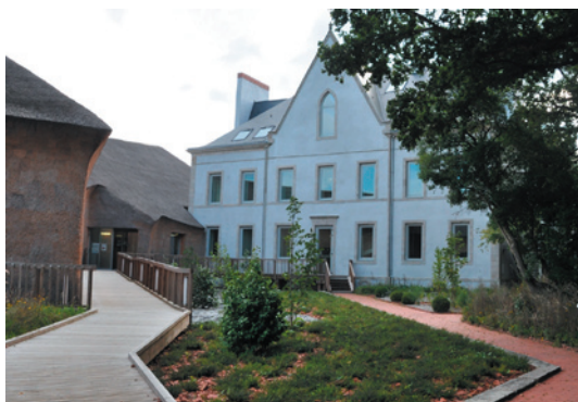
La demeure de Beautour, restaurée