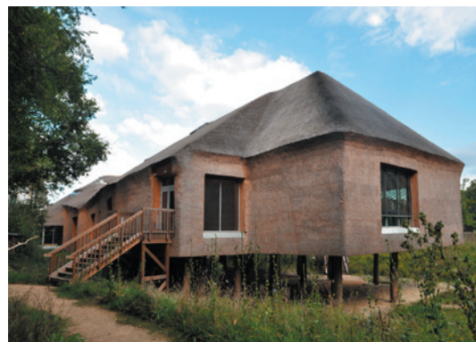
L'extension, contemporaine, abrite les collections

Avec la réhabilitation de la demeure de Georges Durand, la réalisation d'une extension de mille quatre cents mètres-carrés est complétée par des aménagements extérieurs (mares, clos des insectes...) qui sont autant d'espaces pédagogiques. La construction privilégie une approche