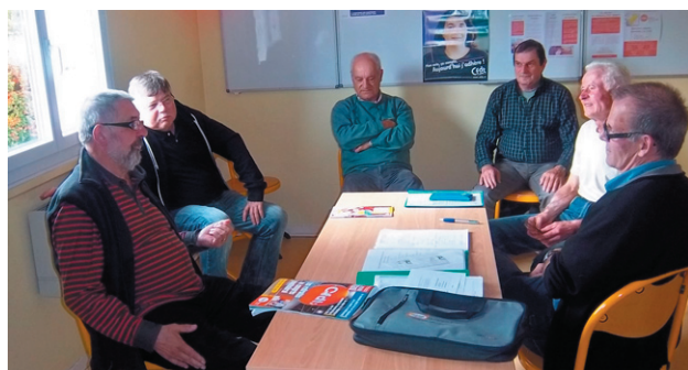
Les visiteurs à la journée «portes ouvertes»

Comment ? En y impliquant les syndicats; car les quelques futurs retraités qui ont franchi les portes de l'Union Locale CFDT soulignent l'importance de cette initiative en y poursuivant leur adhésion.