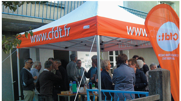
Un événement à l'union locale CFDT des Herbiers

mesurer combien de personnes à partir des adhérents auront fait le dossier ACS. Peut-être aurons-nous d'heureuses surprises !